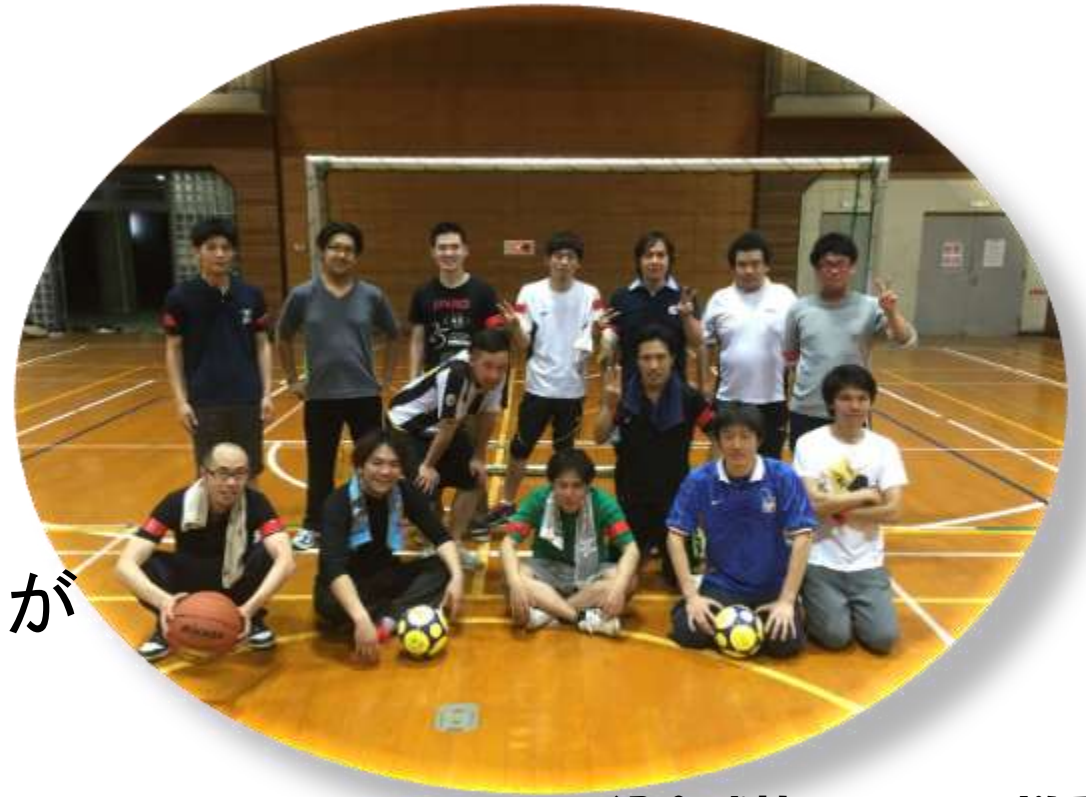
組合球技サークルの様子