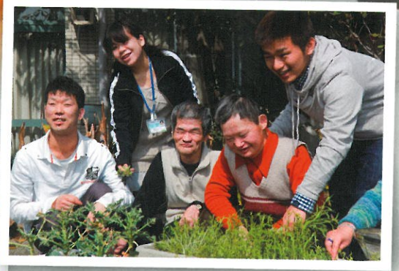
創作活動を通じてリフレッシュされたり、今まで経験したことがない活動による自信回復は、ご利用者様にとって、大きな喜びとなります。